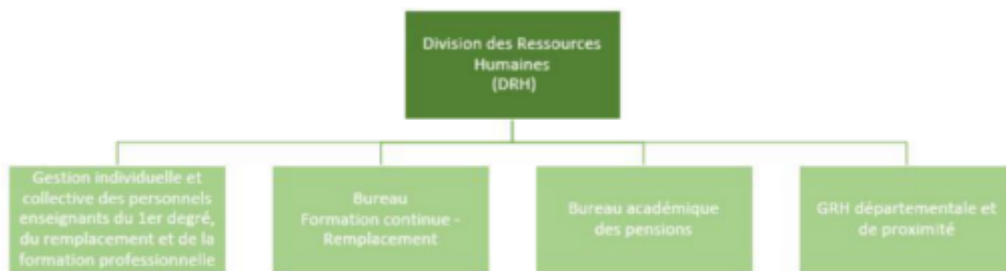
Organigramme de la DRH (bureaux départementaux)