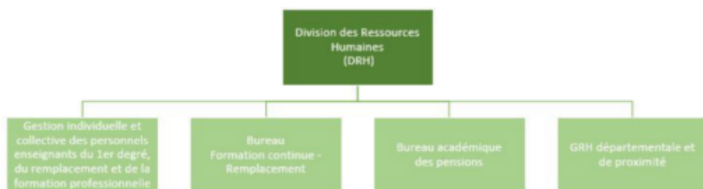
Organigramme de la DRH (bureaux départementaux)